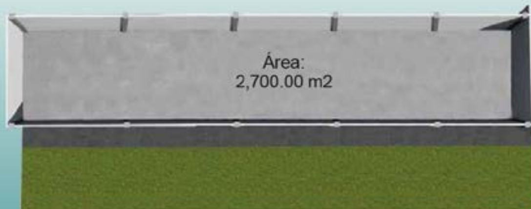
Ejemplo Local 21