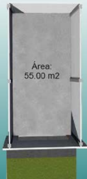
Ejemplo Local 16