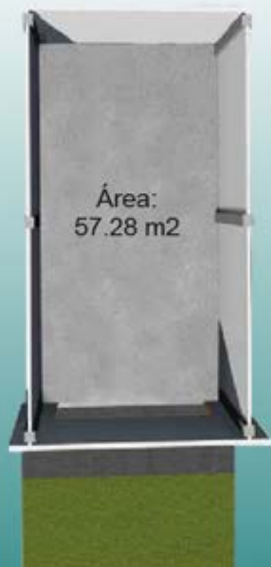
Ejemplo Local 05